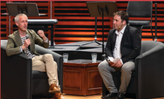
Sébastien Daucé et l'Ensemble Correspondances