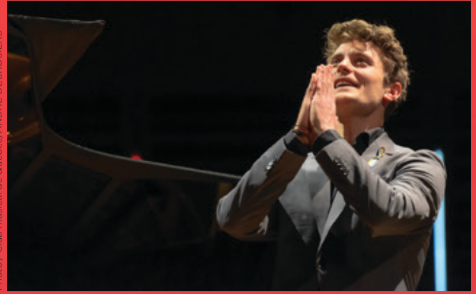
Jakub Józef Orliński