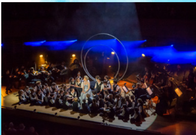
Joyce DiDonato et la Maîtrise des petits chanteurs de Québec dans EDEN

RENSEIGNEMENTS ET TRANSACTIONS EN LIGNE clubmusicaldequebec.com Reçu d'impôt émis.