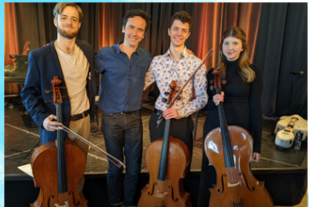
Cours de maître avec Jean-Guihen Queyras