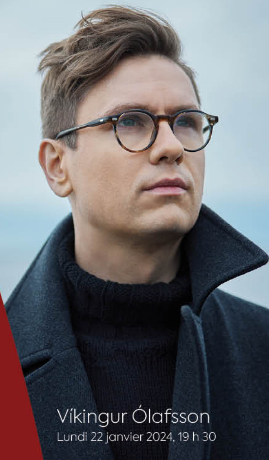
Víkingur Ólafsson Lundi 22 janvier 2024, 19 h 30