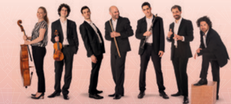
ISRAELI CHAMBER PROJECT